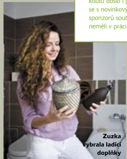
Zuzka vybrala ladící doplňky

FOTKA VLEVO Stojící toaleta a sedátko na toaletu, 1890 a 890 Kč, vše Vitra; obklad Combi Otep, pro celou koupelnu a toaletu, 40 000 Kč, ozdobný obklad Combi, 2199 Kč/ks, vše Rako; košík Asunden, Ikea, 149 Kč